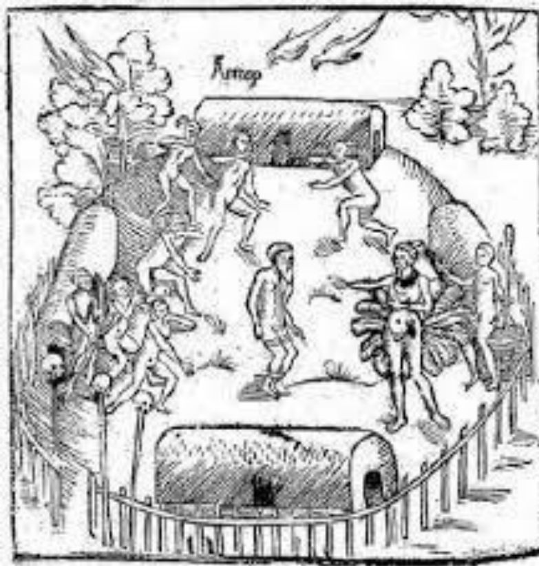
Figura 2: maloca, com Staden no centro.